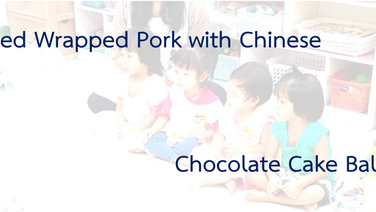
Chocolate Cake Balls