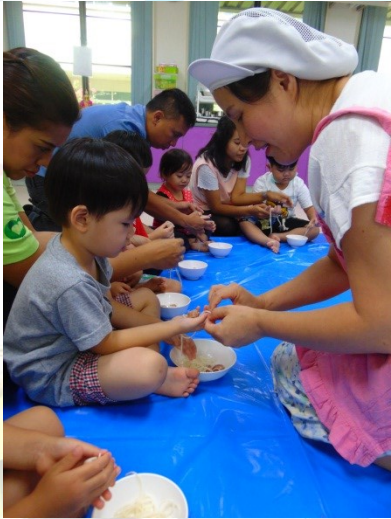
Deep Fried Wrapped Pork with Chinese Noodle