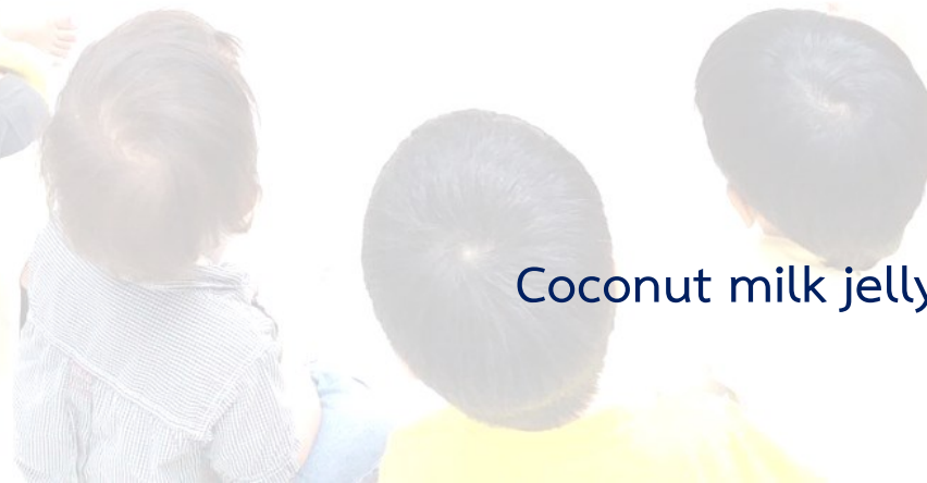
Coconut milk jelly