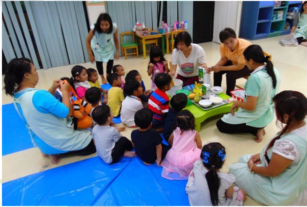
Mango and Sticky Rice